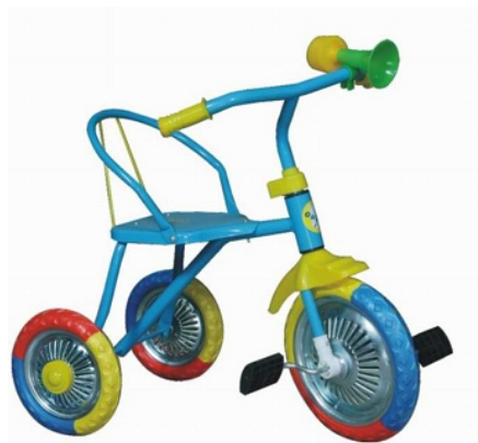
TR 236 PACKING: 62 x 49 x 31.5cm/6PCS