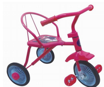
TR 235 PACKING: 54 x 42 x 31.5cm/6PCS